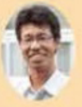
お庭のコンシェルジュ 宮崎